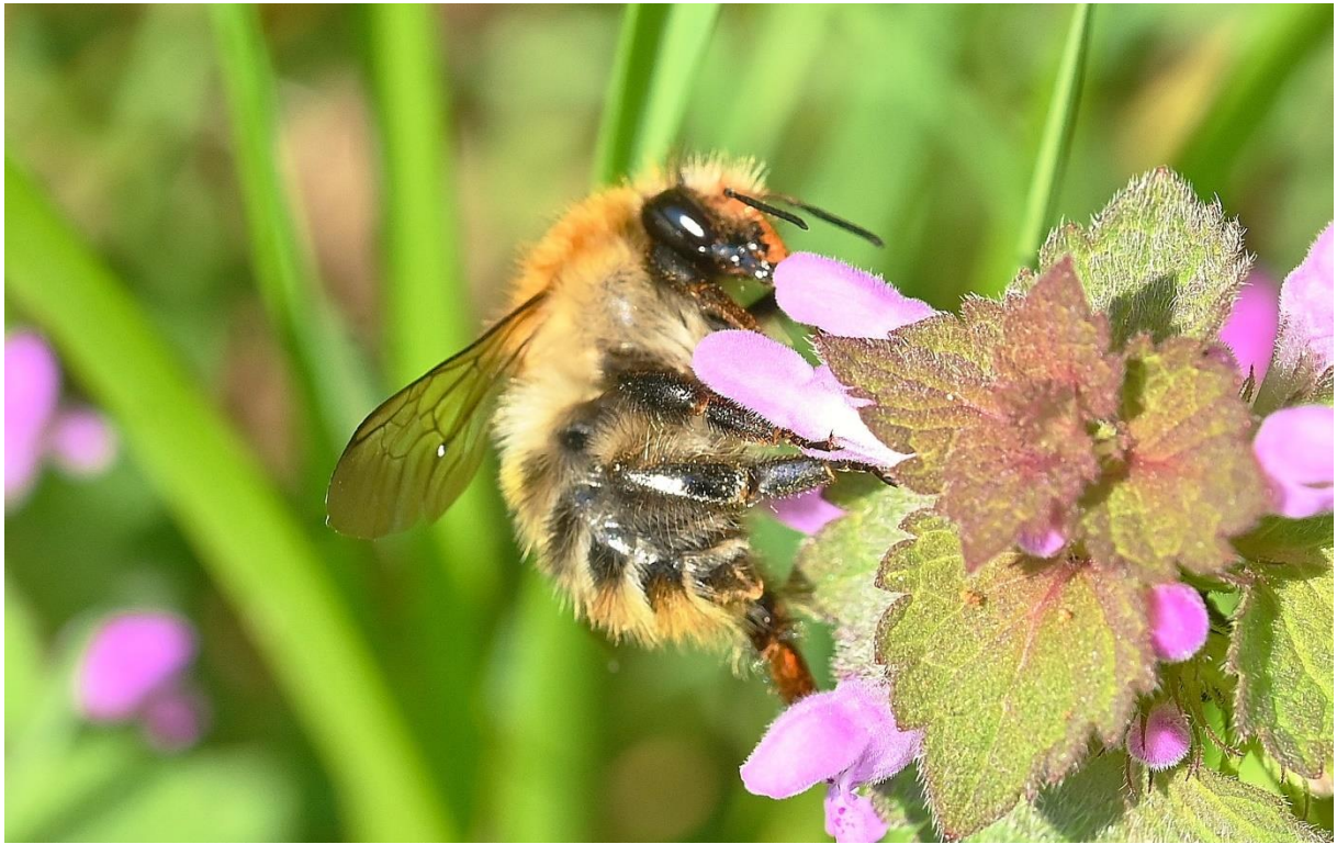
Ackerhummel, Foto: NABU/Peter Brixius