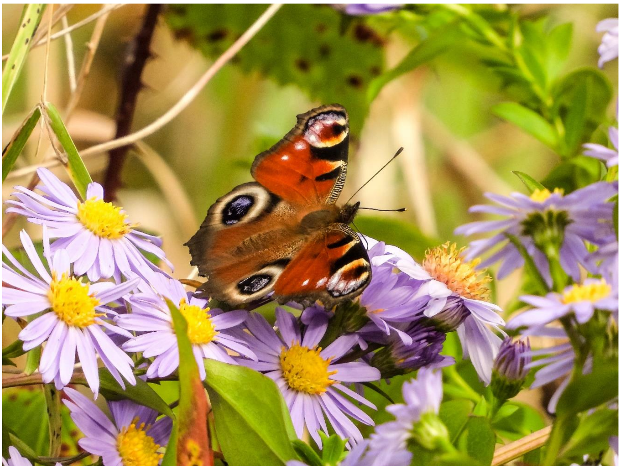
Tagpfauenauge, Foto: NABU/Kathy Büscher