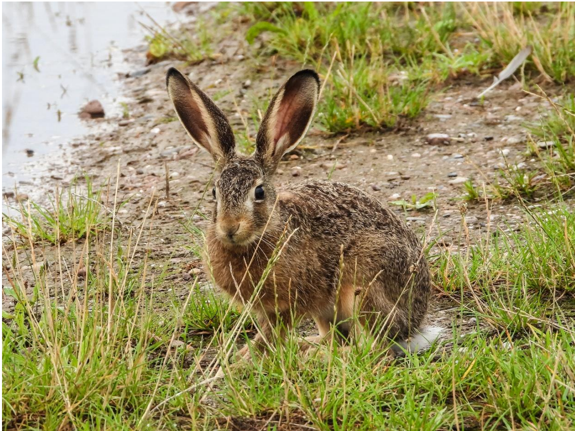
Feldhase, Foto: NABU/Kathy Büscher