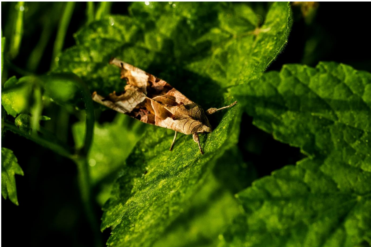
Achateule, Foto: Pixabay/Detroitius