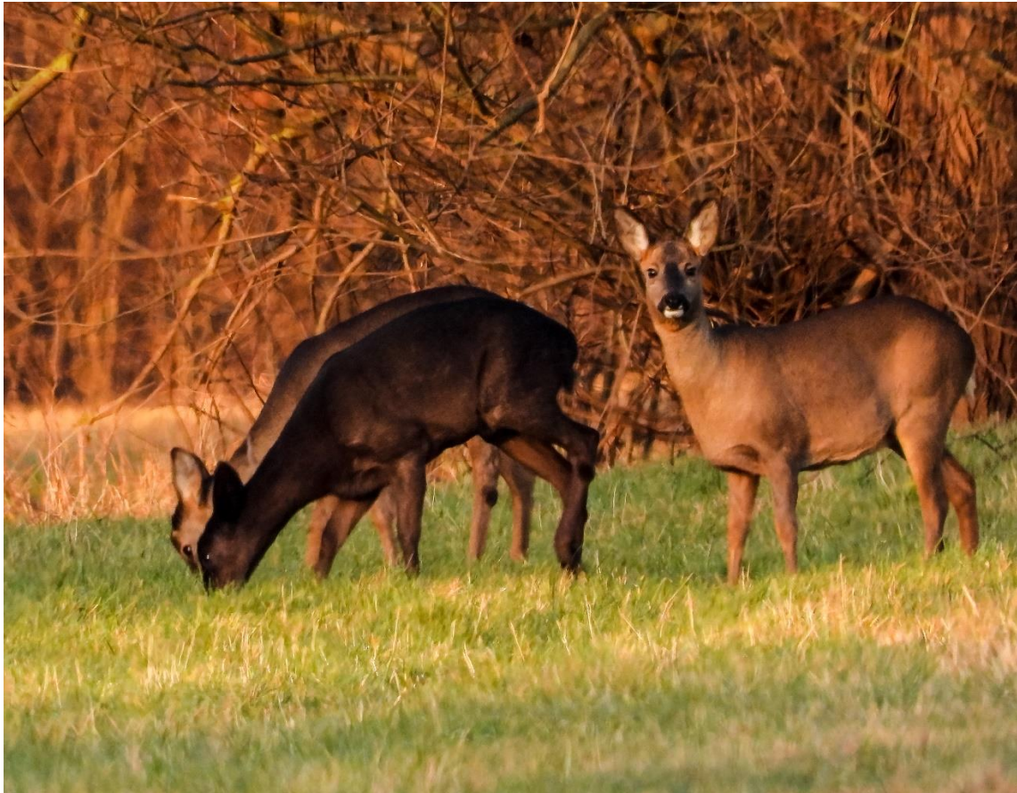
Rehe, Foto: NABU/Kathy Büscher