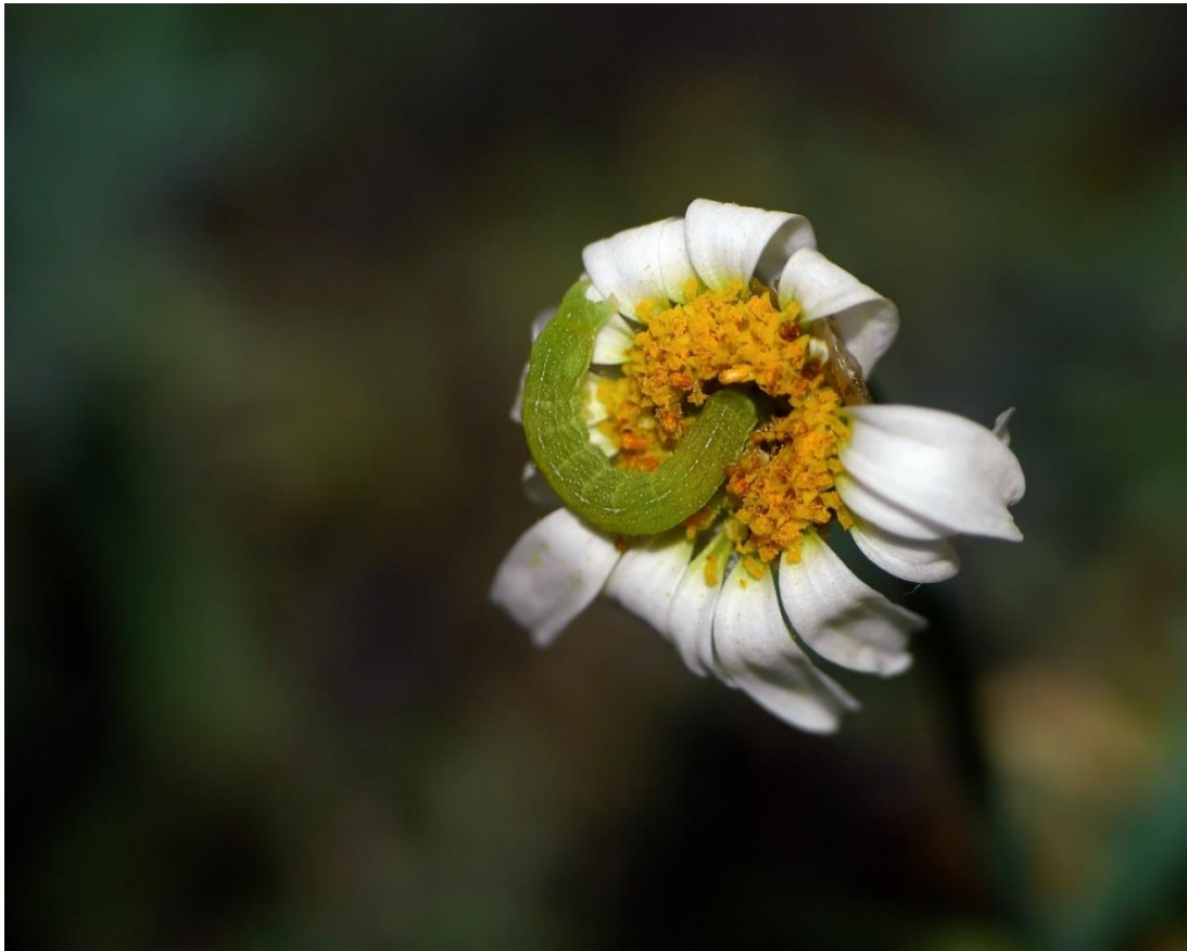
Raupe der Achateule, Foto: Pixabay/J_Blueberry