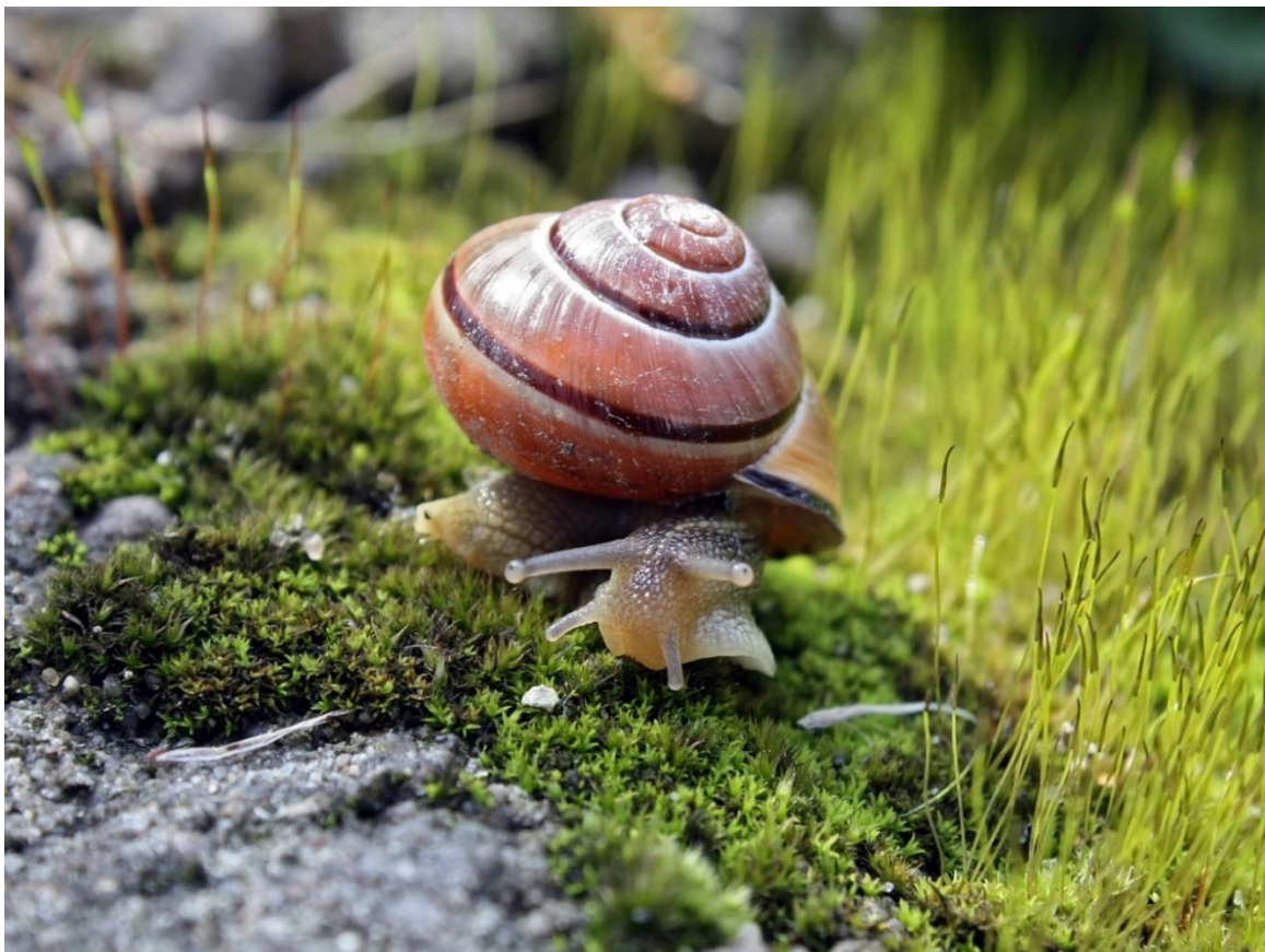
Hainbänderschnecke, Foto: Von.grzanka

( https://commons.wikimedia.org/wiki/File:Cepaea_nemoralis_on_moss_edited.jpg ), „Cepaea nemoralis on moss edited“, https://creativecommons.org/licenses/by-sa/3.0/legalcode