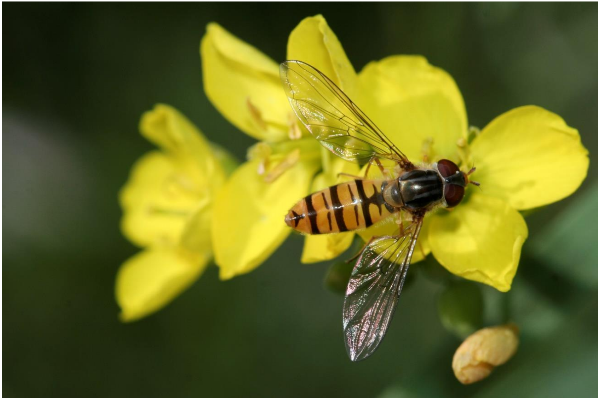
Hainschwebfliege, Foto: NABU/Helge May